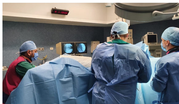
Der C-Bogen wird am Patienten platziert